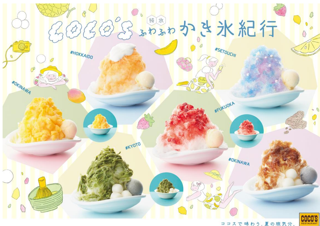
ココスで味わう、夏の旅気分。

この夏は、ココスの「ふわふわかき氷」でご当地グルメ旅気分を味わってみてはいかがでしょうか。